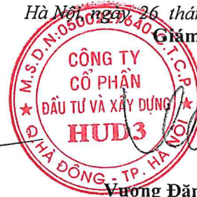
Vương Đăng Phương